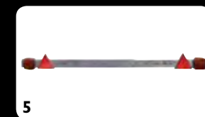
Tabella ingombri - Overall dimensions chart - Diagramme de dimensions hors-tout